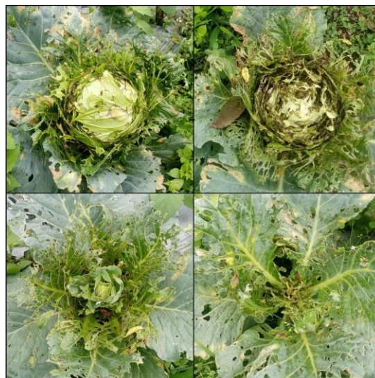
Gambar 1. Kerusakan Tanaman Kubis oleh Crociodolomia pavonana di Lahan Sentra Kubis Desa Kopeng.

rendah ini memiliki peran penting karena gingerol termasuk senyawa fenolik yang sensitif terhadap panas dan mudah mengalami perubahan struktur kimia bila terpapar suhu tinggi dalam durasi lama.