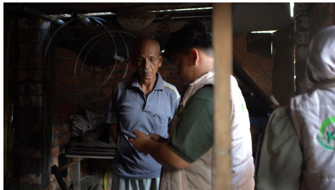
Gambar 1. Observasi dan sosialisasi tentang google maps

Observasi awal yang dilakukan juga memperlihatkan kendala utama sebagian besar pelaku UMKM belum terbiasa menggunakan perangkat berbasis internet sebagai sarana pengembangan usaha. Mereka hanya menguasai penggunaan media komunikasi sederhana, sementara peluang pemanfaatan media digital belum sepenuhnya tersentuh. Akibatnya, produk yang dihasilkan hanya beredar di wilayah lokal dan belum mampu menjangkau pasar yang lebih luas (Harwindito et al., 2025). Temuan ini mempertegas bahwa peningkatan keterampilan digital menjadi kebutuhan penting bagi UMKM agar mampu bersaing di era transformasi digital.