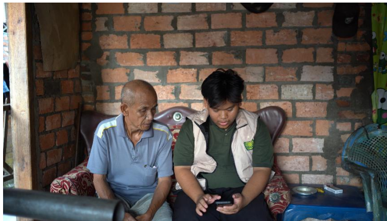
Gambar 2. Proses pembuatan titik google maps

Tahap akhir berupa penyerahan hasil kepada pelaku UMKM dilakukan dengan pemberitahuan bahwa lokasi usaha mereka telah berhasil ditambahkan di Google Maps. Hal ini memberi rasa percaya diri baru bagi para pelaku usaha karena mereka kini memiliki sarana promosi digital yang dapat diakses oleh konsumen dari berbagai daerah. Meskipun pada tahap ini mereka belum sepenuhnya memahami cara pengelolaan lanjutan, keberadaan titik lokasi di Google Maps menjadi langkah awal yang penting untuk membuka peluang promosi berbasis teknologi.