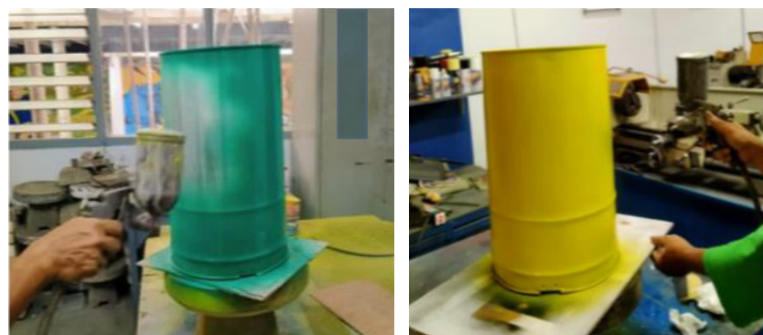
Gambar 3. Proses pengaplikasian cat dasar

Setelah kaleng dibersihkan dan dalam kondisi kering, tahap berikutnya adalah pengaplikasian cat dasar (primer) (Gambar 3). Pada tahap ini dilakukan pelapisan cat dasar (primer) pada seluruh permukaan luar kaleng dengan menggunakan spray gun . Cat dasar berfungsi meningkatkan daya rekat lapisan cat berikutnya sekaligus melindungi logam dari potensi korosi akibat kelembaban udara. Pemilihan cat dasar yang tepat juga membantu menciptakan permukaan yang rata sehingga mempermudah proses dekorasi visual. Cat dasar dipilih berdasarkan material kaleng cat (pelat timah- tinplate ) agar terhindar dari korosi dan tahan terhadap perubahan cuaca. Tahap ini menjadi fondasi penting dalam menjaga ketahanan dan keawetan produk. Warna cat dasar yang dipilih adalah yang bernuansa cerah (kuning, hijau, dan oranye) dengan tujuan memudahkan para peserta dalam membuat gambar ilustrasi di atasnya.