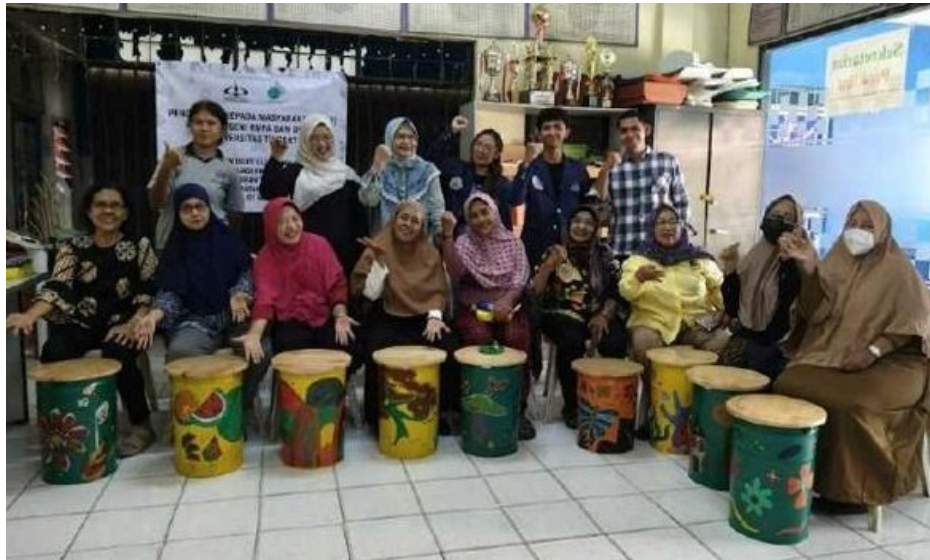
Gambar 5. Peserta dan hasil pelatihan

Tahap akhir dari kegiatan PkM ini adalah evaluasi pelaksanaan kegiatan. Evaluasi dilakukan melalui pengisian kuesioner, diskusi, dan pengamatan langsung terhadap hasil karya peserta, sehingga diperoleh gambaran menyeluruh mengenai efektivitas metode yang digunakan (Ariani et al., 2025). Hasil evaluasi ini menjadi dasar untuk menyusun rekomendasi perbaikan dan pengembangan program PkM pada periode berikutnya, agar manfaat yang diberikan dapat lebih optimal dan berkelanjutan bagi para pelaku UMKM di wilayah Tanjung Duren. Berdasarkan hasil evaluasi, diperoleh penilaian peserta terhadap keberhasilan program, identifikasi kendala yang dihadapi peserta, serta tingkat pemahaman dan keterampilan yang diperoleh selama proses pelatihan. Dari pengisian kuesioner oleh para peserta, diperoleh hasil sebagai berikut: 10 peserta menyatakan program berjalan dengan baik, 10 peserta menyatakan materi yang disampaikan mudah dipahami dan diterapkan, 2 dari 10 peserta mengalami kendala dalam menuangkan ide berupa gambar, 2 dari 10 peserta merasa belum percaya diri untuk mengaplikasikan warna pada elemen dekoratif, 10 peserta menyatakan mendapatkan pengetahuan dan keterampilan yang bermanfaat setelah mengikuti kegiatan ini. Hasil evaluasi tersebut dapat dilihat pada diagram (Gambar 6).