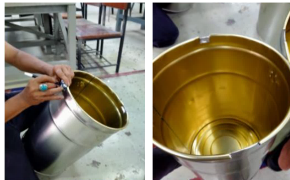
Gambar 2. Kaleng bekas cat yang telah dibersihkan

Pembekalan teoritis dilanjutkan dengan penyampaian akan peran desain dalam perancangan produk. Pemahaman tentang aspek desain menjadi salah satu elemen penting yang perlu disampaikan kepada peserta pelatihan sebelum konsep desain tersebut diterapkan (Ariani, 2018). Dalam kesempatan tersebut instruktur memberikan materi dasar-dasar desain yang berhubungan dengan teori warna, proporsi, komposisi, dan aksentuasi. Setelah menyampaikan materi yang bersifat teori, pelatihan dilanjutkan dengan pemberian contoh (demonstrasi) proses pemanfaatan kaleng bekas cat menjadi wadah serbaguna. Pada tahap awal, instruktur memberikan contoh proses menyiapkan kaleng bekas dengan cara dibersihkan sebelum dikembangkan lebih lanjut. Sisa cat, debu, dan kotoran pada permukaan bagian dalam maupun luar kaleng dibersihkan menggunakan air, sabun, atau cairan pembersih khusus (gambar 2). Proses ini tidak hanya bertujuan untuk menghilangkan residu bahan kimia yang dapat mengganggu hasil akhir, tetapi juga untuk memastikan kaleng dalam kondisi higienis. Pembersihan yang baik akan memudahkan tahap pengecatan dan dekorasi berikutnya, karena permukaan menjadi lebih rata dan bebas dari lapisan yang berpotensi mengurangi daya lekat cat.