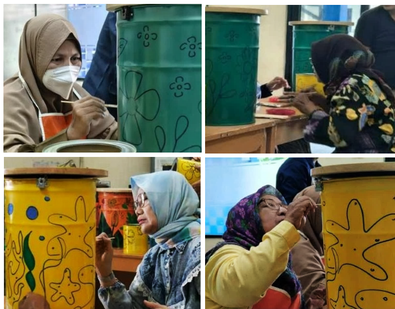
Gambar 4. Proses penerapan elemen dekoratif

Setelah penerapan elemen dekoratif selesai, maka tahap terakhir, yaitu pembuatan tutup berbahan kayu. Penutup kaleng ini terbuat dari sambungan lembaran kayu papan yang dibentuk bulat, dengan ukuran yang disesuaikan dengan ukuran mulut kaleng. Tutup ini memiliki fungsi ganda: melindungi isi wadah dari debu dan kotoran serta memberikan kekuatan tambahan sehingga produk dapat difungsikan sebagai bangku atau meja kecil. Pemilihan material kayu yang kuat dan tahan lama akan mendukung keamanan penggunaan, sementara finishing pada permukaan kayu berupa cat transparan ( glossy ) menyesuaikan dengan tema dekorasi kaleng agar tercipta harmoni visual dan bernilai jual. Pada bagian bawah kayu dibuat lapisan yang berukuran sedikit lebih kecil dari diameter kaleng yang berfungsi sebagai mengunci agar tutup tidak mudah bergeser. Kegiatan PkM yang berfokus pada pengembangan produk dari kaleng bekas cat ini menghasilkan 10 (sepuluh) wadah sekaligus bangku berorientasi profit bagi pelaku UMKM di Tanjung Duren, Jakarta Barat.