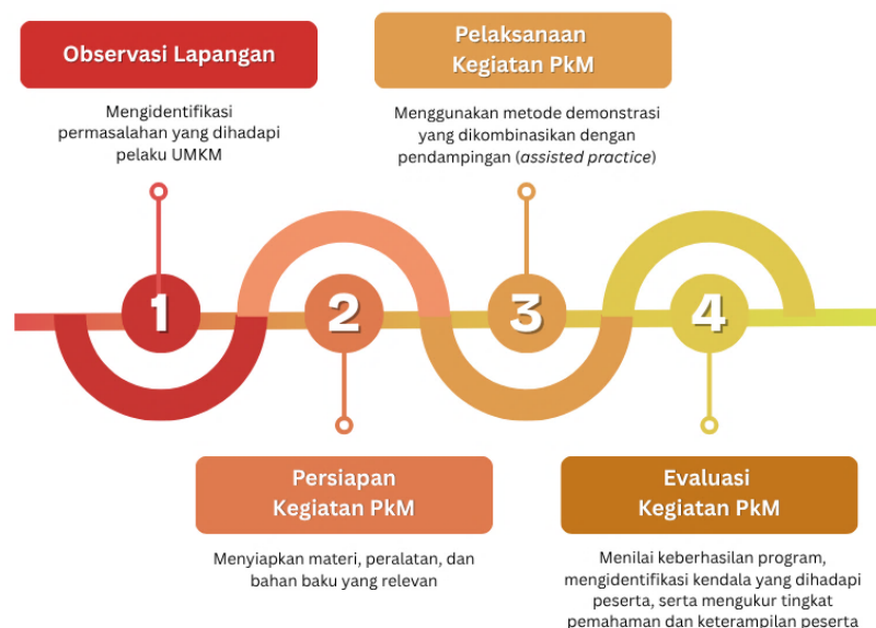
Gambar 1. Bagan alur tahapan pelaksanaan PkM

inovasi berbasis reuse . Sebagai penerapan metode demonstrasi dalam kegiatan pelatihan ini, instruktur memberikan penjelasan dan memperagakan proses pembuatan produk wadah penyimpanan multifungsi. Pendampingan dilakukan untuk memastikan setiap peserta dapat mempraktikkan keterampilan yang dipelajari dengan bimbingan langsung, sehingga pengetahuan yang diperoleh bersifat aplikatif dan kontekstual. Tahap akhir kegiatan adalah evaluasi, yang bertujuan untuk menilai keberhasilan program, mengidentifikasi kendala yang dihadapi peserta, serta mengukur tingkat pemahaman dan keterampilan yang diperoleh selama proses pelatihan. Tahapan kegiatan PkM Pengembangan Produk dari Kaleng Cat Bekas Cat menjadi wadah penyimpanan multifungsi dapat dilihat pada bagan alur berikut ini: