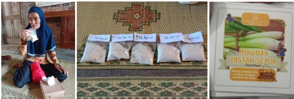
Gambar 3. Hasil Kemasan Serbuk Instan Minuman Sereh Wangi dan Label Produk

Pengemasan minuman instan serbuk sereh wangi relatif mudah yaitu menggunakan plastik yang sudah dilengkapi segel. Hasil kegiatan pengemasan dan pelabelan terlihat pada Gambar 3.