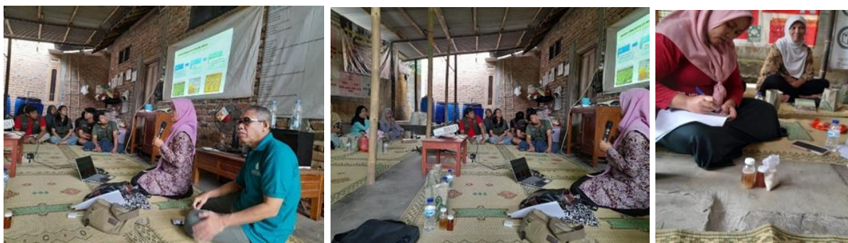
Gambar 4. Penyuluhan Manajemen Usaha

Pelatihan manajemen usaha dilakukn dengan metode ceramah atau penyuluhan. Dalam acara ini diterangkan bagaimana mengatur alur usaha dari mengelola bahan baku, proses produksi, pembukuan produk, pembukuan keuangan hingga pengelolaan pemasaran, (Gambar 4). Manajemen merupakan titik lemah bagi kelompok Wanita tani, disebabkan kesibukan mereka sebagai ibu rumah tangga ditambah banyaknya program di pedukuhan maupun di kelurahan. Namun antusiasme warga cukup tinggi untuk mempelajari pengelolaan usaha agar lebih efisien.