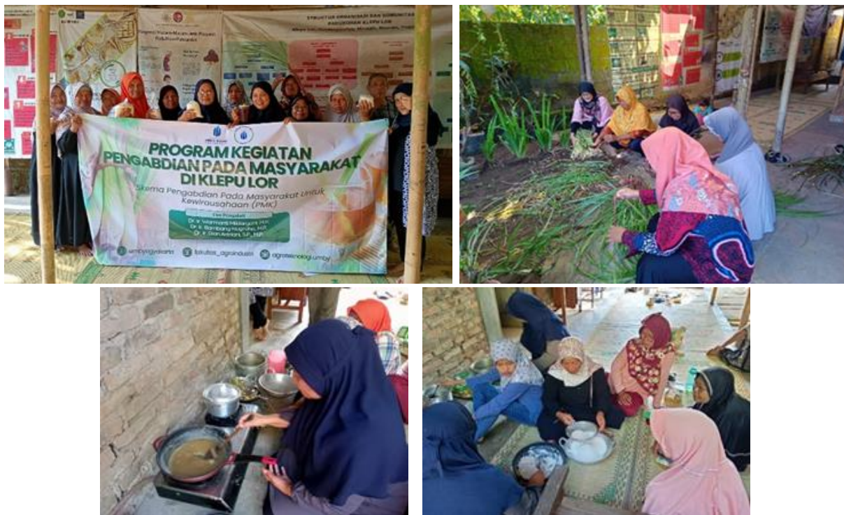
Gambar 2. Proses Pelatihan Produksi Minuman Instan Sereh Wangi

Adapun suasana pelatihan produksi minuman instan sereh wangi disajikan pada Gambar 2.