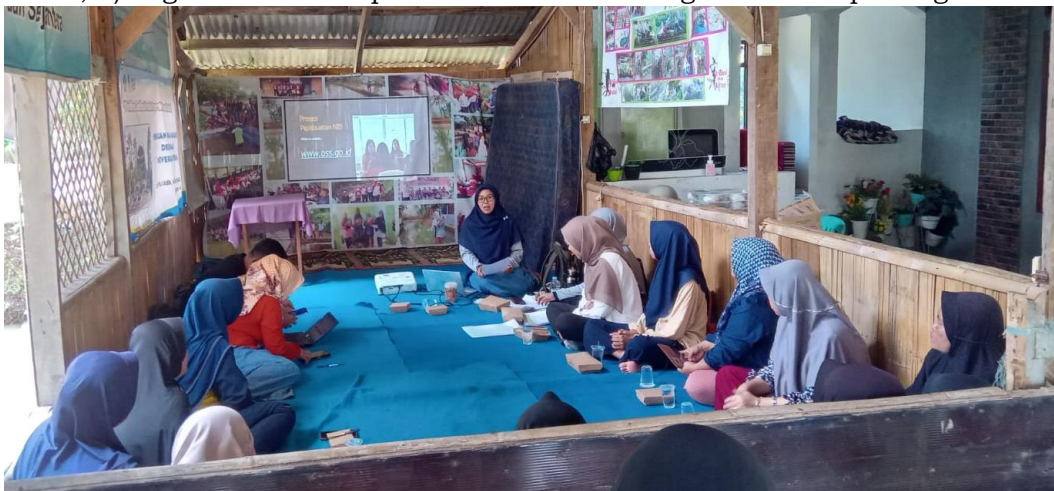
Gambar 3. Kegiatan Sosialisasi NIB, Izin Edar SPP-IRT, dan Sertifikasi Halal UMK Situ Udik

Di akhir kegiatan sosialisasi, dilakukan diskusi dengan beberapa pelaku UMK di Desa Situ Udik yang belum memperoleh izin edar SPP-IRT dan sertifikat halal untuk mengidentifikasi permasalahan yang dihadapi ( Gambar 3 ). Berdasarkan hasil diskusi, faktor penyebab UMK Situ Udik belum memiliki legalitas usaha, di antaranya adalah kurangnya pengetahuan tentang prosedur, keterbatasan sumber daya, dan stigma kerumitan dalam proses pengajuannya, proses pengajuan yang lama, serta biaya yang dinilai mahal. Menurut Kurniawan & Astuti (2018) dan Savitri et al. (2023), berbagai faktor sebagian besar UMK belum memiliki legalitas usaha, di antaranya adalah: 1) kurangnya pengetahuan; 2) biaya yang mahal; 3) stigma kerumitan prosedur dan merasa legalitas tidak penting.