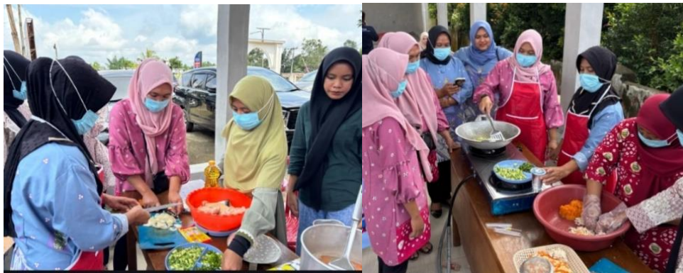
Gambar 6. Aktivitas Demo Memasak Menu PMT Krokot Umbi Makaroni Tinggi Protein Hewani

Menu yang diolah adalah Krokot Umbi Makaroni Tinggi Protein. Menu ini merupakan makanan sumber protein tinggi yang mengandung protein dari telur dan daging ayam. Penggunaan daging ayam dapat diganti dengan daging giling ikan lokal di daerah masing-masing. Bahan lokal yang digunakan adalah ubi jalar sebagai sumber karbohidrat yang memiliki rasa manis alami. Penggunaan makaroni pada menu ini bersifat opsional. Selain itu, ditambahkan juga sayur-sayuran sebagai sumber vitamin, mineral dan serat. Selama proses pengolahan, peserta juga diedukasi agar tetap menjaga sanitasi dan hygiene serta memperhatikan penggunaan alat untuk bahan mentah bahan matang agar tidak terjadi kontaminasi silang. Diharapkan agar menu ini dapat menjadi inspirasi dalam PMT lokal di posyandu masing-masing.