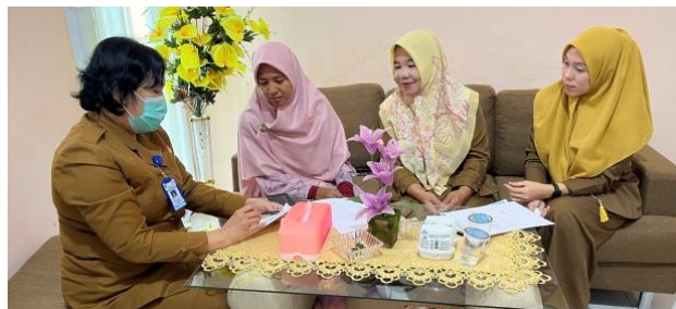
Gambar 1. Kegiatan Survey dan Assesmen ke Puskesmas Sungai Lilin dihadiri oleh Kepala Puskes dan Staff

Kegiatan terdiri dari beberapa rangkaian yaitu survey dan assessment, penyuluhan (penyampaian materi) dan Praktek atau Demo. Tahapan pertama, survey dan assessment dilakukan ke puskesmas dan beberapa posyandu sebagai sampel untuk mencari informasi terkait kondisi posyandu dan kadernya serta analisis kebutuhan pembekalan bagi kader posyandu. Adapun dokumentasi kegiatan survey dan assessment dapat dilihat pada Gambar 1. Tahapan kedua, melakukan kegiatan penyuluhan dengan menyampaikan materi. Tahapan ketiga, melakukan praktik dan demo. Kegiatan tahap dua dan tiga, dilaksanakan selama 2 hari di lokasi yang berbeda.