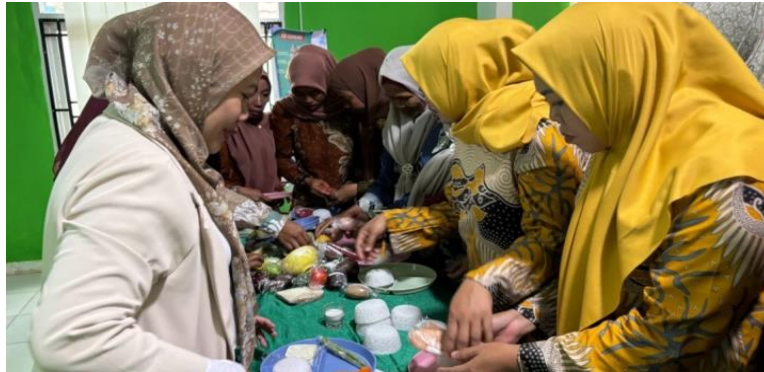
Gambar 3. Peserta Melakukan Simulasi Penyusunan Menu Gizi Seimbang

Setelah sesi penyampaian materi dan praktik, kemampuan keterampilan peserta dalam pengukuran BB/TB menggunakan antropometri kemudian di evaluasi dengan cara menguji beberapa orang peserta secara acak. Sebagian besar peserta uji mampu mengukur dan membaca alat antropometri dengan benar. Kemampuan dan keterampilan ini sangat penting sebagai bekal bagi kader posyandu dalam menentukan Status gizi ibu dan anak.