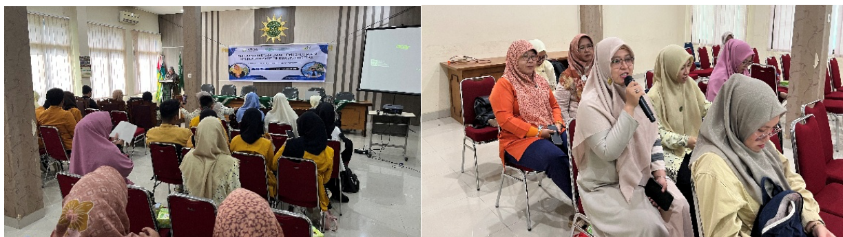
Gambar 1. Tahap Sosialisasi dan Diskusi

Kegiatan pendampingan dilaksanakan di Aula PDA Kota Palembang. Total peserta yang hadir mencapai 34 peserta yang terdiri atas 17 anggota APUNA (dua di antaranya berasal dari APUNA Daerah Banyuasin dan Ogan Ilir), 7 siswa SMK Muhammadiyah yang berminat dengan kegiatan, 4 pengurus PD NA, serta 6 tim pengabdian. Kehadiran pengurus PD NA merupakan bentuk dukungan agar kegiatan sejenis dapat dilaksanakan di tempat lain atau di tingkat wilayah. Para peserta menunjukkan antusiasme yang tinggi selama kegiatan berlangsung. Hal ini terlihat dari banyaknya pertanyaan yang diajukan, khususnya pada sesi praktik penggunaan aplikasi bisnis. Dokumentasi kegiatan pendampingan dapat dilihat pada Gambar 1.