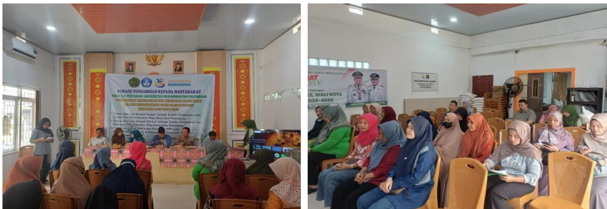
Gambar 3. Kegiatan Penyampaian Materi tentang Pembukuan Sederhana dan Penghitungan Harga Pokok Penjualan HPP di Kelompok PKK Kelurahan Plaju Darat Kota Palembang

Salah satu aspek yang paling menarik bagi peserta adalah kegiatan praktik dan simulasi. Peserta secara langsung mencoba membuat pembukuan sederhana dan menghitung HPP produk yang mereka hasilkan selama sesi ini. Ketika tim pengabdian mendampingi mereka langsung, peserta terlihat aktif bertanya dan berbicara tentang masalah mereka ketika mereka mengalami kesulitan dengan perhitungan atau pencatatan.