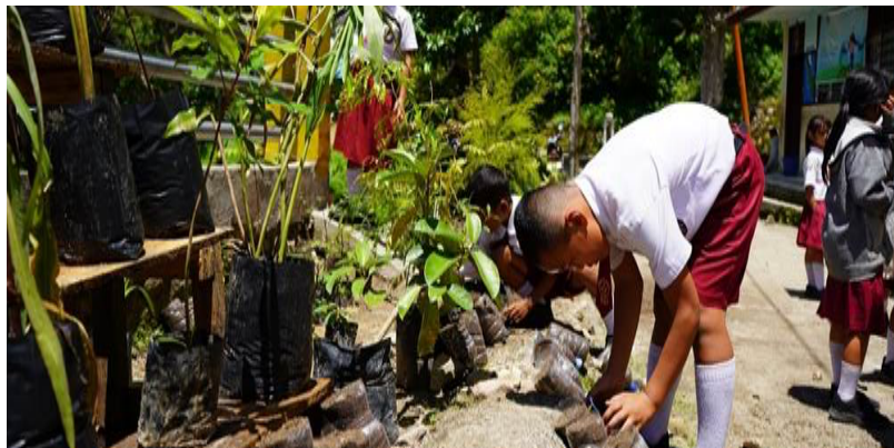
Gambar 4. Hasil Evaluasi Perubahan Sikap dan Kesadaran Lingkungan oleh Pelajar

Kedua , perubahan sikap dan kesadaran lingkungan pelajar. Capain ini dapat diamati berdasarkan peningkatan perhatian/antusias para pelajar terhadap kebersihan lingkungan sekolah setelah kegiatan dilaksanakan. Selama proses observasi di hari kedua terdapat 10-15 pelajar yang mulai melakukan pengumpulan sampah dan bahkan ada yang membawa sampahnya dari rumah untuk dikumpulkan di sekolah. Perubahan sikap ini merupakan salah satu indikator keberhasilan pendidikan lingkungan. Para pelajar dapat mulai sadar bahwa tugas menjaga kebersihan lingkungan bukan hanya tugas guru dan petugas kebersihan, namun menjadi tugas bersama dari seluruh komponen yang terdapat di sekolah. Berdasarkan penelitian juga menjelaskan bahwasannya Program Zero Waste di sekolah sangat efektif dalam membangun budaya yang berkelanjutan dan memberikan dampak lingkungan, sosial dan ekonomi sekolah (Khalid & Purnawati, 2024).