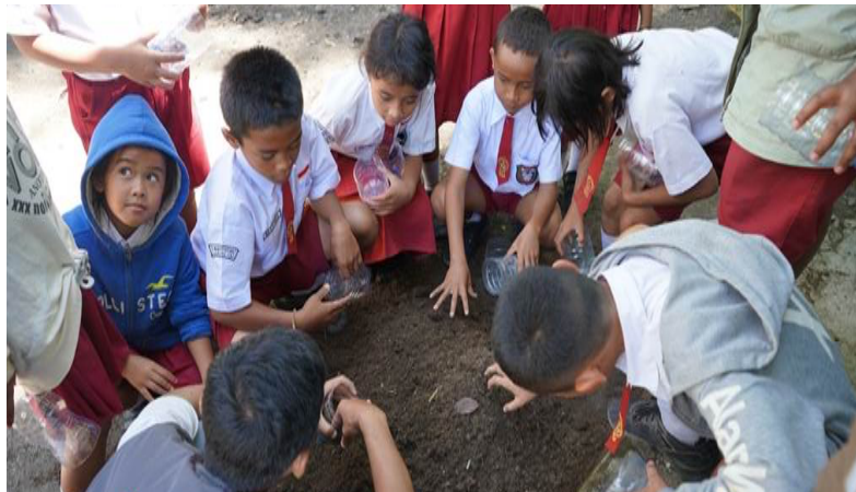
Gambar 2. Pelatihan Pembuatan Pupuk Kompos oleh Pelajar

Pelaksanaan proses demonstrasi ini dari tim pelaksana menunjukkan tahapan-tahapan pembuatan kompos yang meliputi mengenai pengumpulan dari bahan organik, pencacahan bahan, penyusunan bahan-bahan komposter dan pengaturan kelembapan bahan kompos. Bahan yang dipergunakan berasal dari lingkungan sekitar sekolah, terkhusus pada sampah daun kering yang gugur pada halaman sekolah dan sisa makanan. Setelah dilakukan proses demonstrasi, dilakukan kegiatan pembagian masing-masing pelajar kedalam kelompok kecil guna melakukan praktik secara langsung dan didampingi oleh seorang guru.