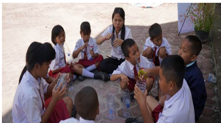
Gambar 3. Pelatihan Pembuatan Vertical Garden oleh Pelajar

Kegiatan selanjutnya, pelaksanaan demonstrasi pembuatan media tanam dari botol bekas dan kayu bekas. Botol plastik yang dipergunakan ini sebagian besar didapatkan dari botol minuman bekas yang sudah dikumpulkan oleh para pelajar. Berikut ini mengenai langkah-langkah pembuatan pot tanaman dari botol bekas. Pertama , membersihkan botol plastik dari sisa makanan/kotoran. Kedua , memotong bagian samping botol yang dipergunakan untuk membuat ruang tanam. Ketiga , membuat lubang kecil untuk drainase dari tumbuhan. Keempat , melakukan pengisian botol dengan campuran tanah dan kompos. Kelima , melakukan penanaman bibit tanam kedalam botol yang sudah dipersiapkan.