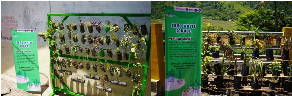
Gambar 5. Hasil Evaluasi Keindahan Lingkungan Sekolah

menjadi pemicu semangat bagi para pelajar di sekolah untuk terus melakukan penjagaan lingkungan dan tidak membuang sampah di sekolah agar terbangunnya tujuan Zero Waste School yang ada di SDN Meat.