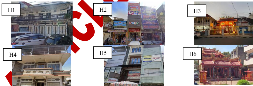
Gambar 4. Tipologi Bangunan Kawasan Pecinan

Selain bangunan ruko, terdapat bangunan kelenteng yang menjadi elemen arsitektur paling dominan dan memiliki nilai historis serta simbolik tinggi dalam kawasan. Bangunan kelenteng mempertahankan ornamen, warna, bentuk atap, serta fungsi sosial-keagamaan yang kuat. Posisi dan karakter visualnya menjadikan kelenteng sebagai landmark , sedangkan ruko lama membentuk lanskap jalan ( streetscape ) yang mendukung keterbacaan identitas kawasan.