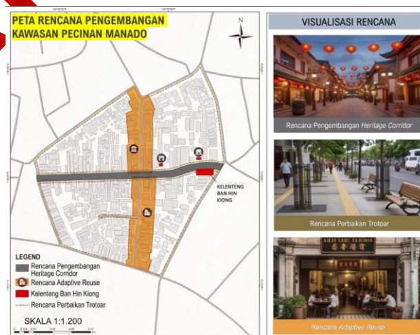
Gambar 7. Peta Rencana Pengembangan Kawasan Pecinan Manado

Pengendalian visual diarahkan pada perlindungan elemen fasad lama yang masih bertahan, penataan papan reklame, dan pengaturan perubahan bangunan agar tetap kontekstual terhadap ritme koridor. Pemanfaatan adaptif dapat menjadi salah satu pilihan pada bangunan tertentu, tetapi keputusan tersebut harus didahului oleh inventarisasi nilai signifikansi, pemeriksaan kondisi struktur, kejelasan kepemilikan, dan kajian kelayakan fungsi (Lanz & Pendlebury, 2022). Konsep pengembangan tersebut ditunjukkan pada peta rencana pengembangan kawasan berikut. Namun, peta ini belum merupakan rencana teknis rinci.