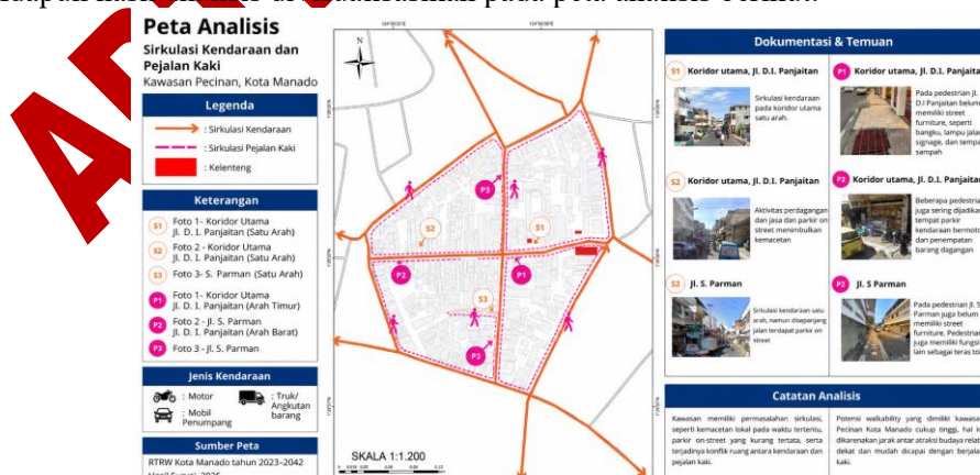
Gambar 3. Analisis Sirkulasi Keedaraan dan Pedestrian

Meskipun demikian, kualitas jalur pedestrian di kawasan masih belum memadai. Kondisi eksisting menunjukkan beberapa hambatan berupa penggunaan trotoar untuk parkir, barang dagangan, dan aktivitas perdagangan; lebar efektif yang terbatas; permukaan yang tidak seragam; serta minimnya peneduh dan fasilitas dasar. Lebar pedestrian pada titik amatan berkisar 1,5–2,0 m, tetapi ruang efektifnya berkurang ketika terjadi okupasi. Pola sirkulasi pejalan kaki pada kawasan selanjutnya dapat dilihat pada gambar berikut. Potensi kemudahan berjalan kaki ( walkability ) di kawasan belum sepenuhnya didukung oleh kualitas jalur yang tersedia. Oleh karena itu, penataan awal perlu berfokus pada pemulihan kontinuitas jalur, pengurangan hambatan, perbaikan permukaan, dan penambahan fasilitas dasar pada segmen yang paling banyak digunakan. Adapun hasil analisis divisualisasikan pada peta analisis berikut.