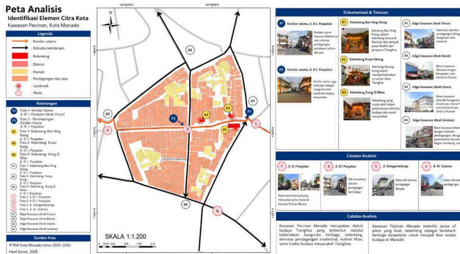
Gambar 5. Analisis Imageability

Adapun analisis kelima elemen utama pembentuk citra kota tersebut dapat dilihat pada peta analisis berikut.