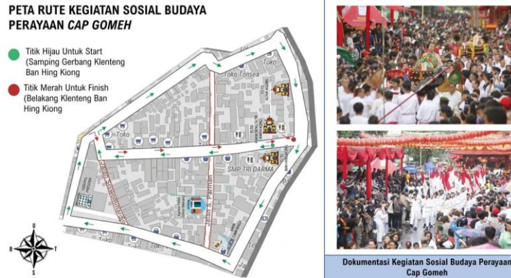
Gambar 6. Peta Aktivitas Budaya