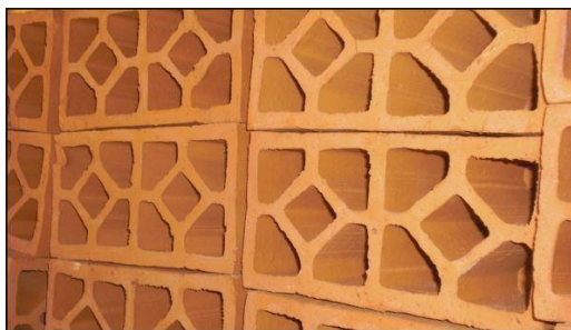
Gambar 1. Roster

Beberapa kerajinan yang dimiliki oleh Banyuwangi tersebut, yang termasuk unik dan menarik adalah roster . Disebut unik karena bentuknya yang memuat beberapa konsep geometri sekaligus dalam satu buah roster , baik itu yang bersifat dua dimensi (bangun datar) dan tiga dimensi (bangun ruang). Roster sendiri merupakan kerajinan yang digunakan untuk ventilasi atau tempat keluar masuknya udara. Menurut Astari (2020:21), roster merupakan salah satu bahan bangunan yang berfungsi sebagai angin-angin atau sebagai lubang ventilasi pada suatu bangunan. Roster merupakan salah satu objek budaya yang berupa kerajinan yang digunakan dalam sebuah bangunan. Dalam kaitannya dengan budaya dapat terlihat dari penggunaan roster secara konvensional yaitu di atas pintu dan jendela dimana juga teraplikasi pada bangunan tradisional Bali (Persada, 2019:457). penggunaan roster pada bangunan tradisional Bali mempertimbangkan unsur estetika agar dapat menyatu dengan bangunan. Dengan bentuk yang unik dan menarik, diyakini mengandung makna tersendiri. Bentuk-bentuk tersebut berhubungan dengan etnomatematika yaitu konsep matematika yang ada dalam budaya masyarakat.