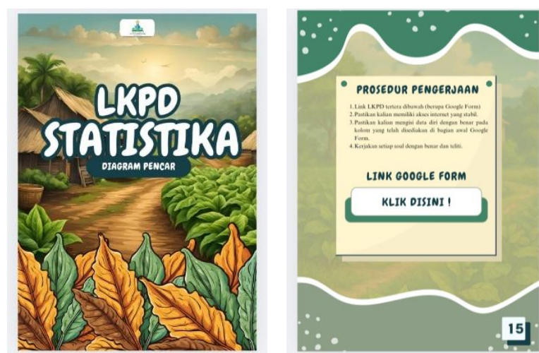
Gambar 3. Tampilan LKPD dan latihan soal interaktif pada E-Modul

Aspek media memperoleh persentase tertinggi yaitu 91% dengan kategori sangat baik. Hal ini menunjukkan bahwa tampilan e-modul memiliki kualitas visual yang baik, navigasi yang jelas, serta konsistensi tata letak yang mendukung kenyamanan belajar siswa. Sementara itu, aspek materi memperoleh persentase sebesar 77% dengan kategori baik. Penyajian materi secara digital melalui platform interaktif dinilai memudahkan siswa dalam mengakses materi kapan pun dan di mana pun. Dari sudut pandang teori pembelajaran multimedia, kombinasi teks, gambar, dan ilustrasi kontekstual dalam e-modul ini sejalan dengan prinsip dual coding yang menyatakan bahwa informasi akan lebih mudah dipahami ketika disajikan melalui saluran verbal dan visual secara bersamaan. Hal ini menunjukkan bahwa desain media berperan penting dalam meningkatkan efektivitas pembelajaran matematika.