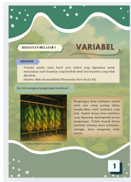
Gambar 2. Tampilan materi diagram pencar berbasis Gudang Tembakau

Aspek media memperoleh persentase tertinggi yaitu 91% dengan kategori sangat baik. Hal ini menunjukkan bahwa tampilan e-modul memiliki kualitas visual yang baik, navigasi yang jelas, serta konsistensi tata letak yang mendukung kenyamanan belajar siswa. Sementara itu, aspek materi memperoleh persentase sebesar 77% dengan kategori baik. Penyajian materi secara digital melalui platform interaktif dinilai memudahkan siswa dalam mengakses materi kapan pun dan di mana pun. Dari sudut pandang teori pembelajaran multimedia, kombinasi teks, gambar, dan ilustrasi kontekstual dalam e-modul ini sejalan dengan prinsip dual coding yang menyatakan bahwa informasi akan lebih mudah dipahami ketika disajikan melalui saluran verbal dan visual secara bersamaan. Hal ini menunjukkan bahwa desain media berperan penting dalam meningkatkan efektivitas pembelajaran matematika.