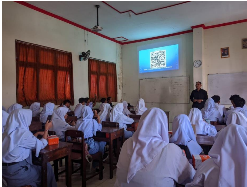
Gambar 3. Pelaksanaan Pelatihan Digital Marketing kepada Siswa SMKN 1 Sukoharjo