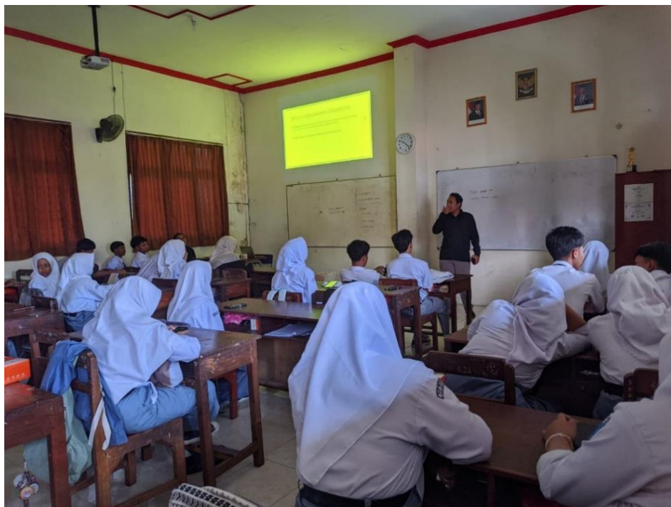
Gambar 2. Kegiatan Pelatihan Manajemen Bisnis di SMKN 1 Sukoharjo