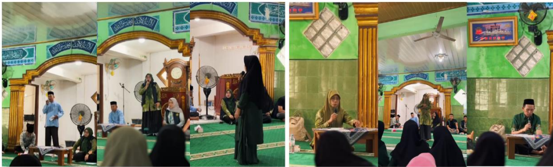
Gambar 2. Dokumentasi Kegiatan Pengabdian kepada Masyarakat

Dalam perspektif psikologi Islam, pengelolaan hati ( tazkiyatun nafs ) memiliki hubungan yang erat dengan kemampuan pengendalian diri ( self-control ) yang berperan dalam membentuk perilaku individu. Hati yang terjaga dan terkelola dengan baik akan mendorong seseorang untuk mampu mengendalikan dorongan hawa nafsu, mengelola emosi secara positif, serta mempertimbangkan nilai-nilai moral dan spiritual dalam setiap tindakan yang dilakukan. Menurut Al-Ghazali, proses penyucian jiwa bertujuan membentuk kepribadian yang berakhlak mulia melalui pengendalian syahwat, amarah, dan berbagai kecenderungan negatif yang dapat menjauhkan manusia dari nilai-nilai ketakwaan. Oleh karena itu, keberhasilan seseorang dalam mengelola hati akan berpengaruh terhadap kemampuan mengambil keputusan secara bijaksana dan bertanggung jawab.