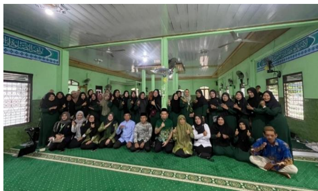
Gambar 4. Dokumentasi Kegiatan Pengabdian kepada Masyarakat

Program ini diharapkan dapat menjadi langkah awal dalam membangun masyarakat yang memiliki keseimbangan antara kecerdasan spiritual dan kesadaran ekonomi syariah. Kegiatan ditutup dengan foto bersama tim Pengabdian kepada Masyarakat, yang terdiri atas dosen dan mahasiswa Universitas Muhammadiyah Palembang, serta warga Desa Terusan Menang.